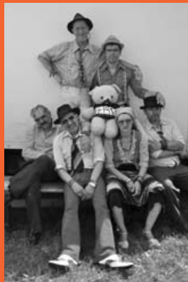
Avec la mascotte aux Eurockéennes de Belfort 2013.

★ Rappelons les tarifs : carte d'abonnement 10€, tarif normal 9€ et tarif réduit 6€.