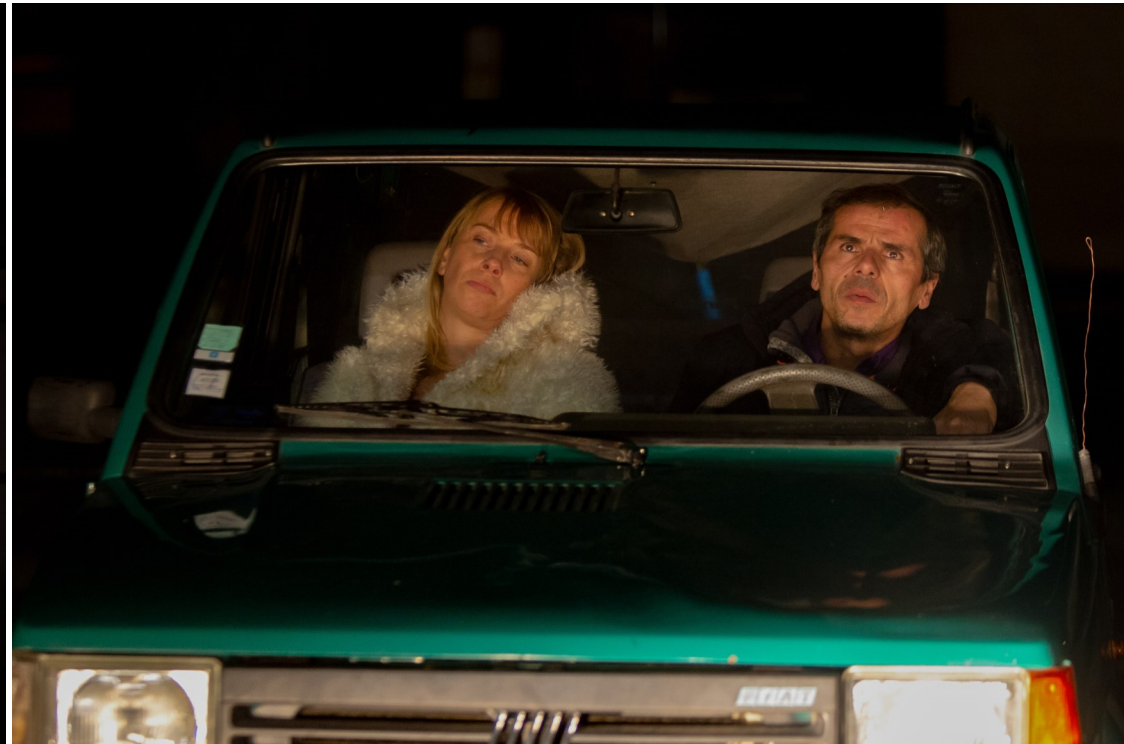
A l'occasion de la sortie de résidence pro aux Abattoirs de Riom (63)