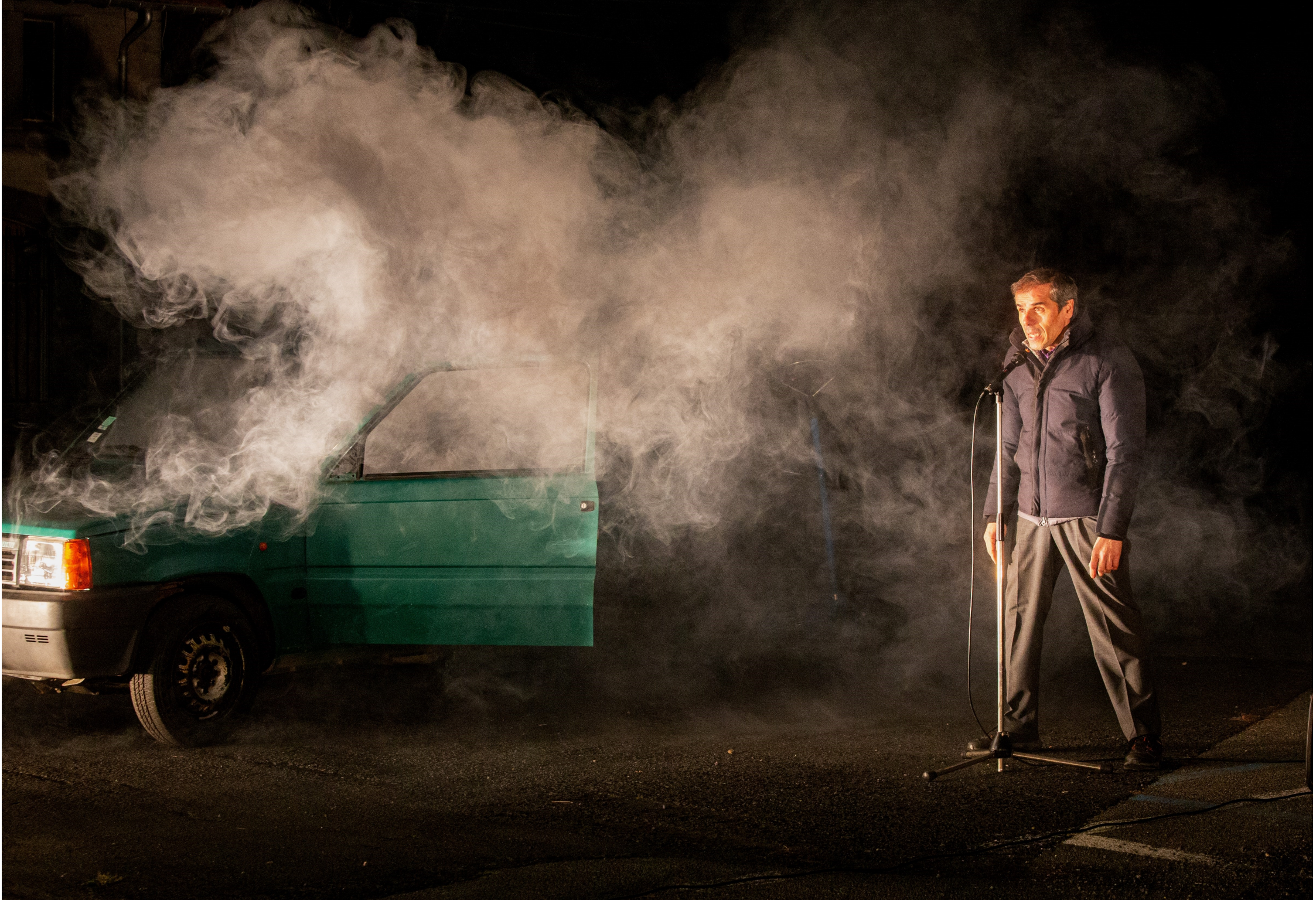
A l'occasion de la sortie de résidence pro aux Abattoirs de Riom (63)